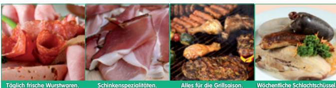
Täglich frische Wurstwaren.