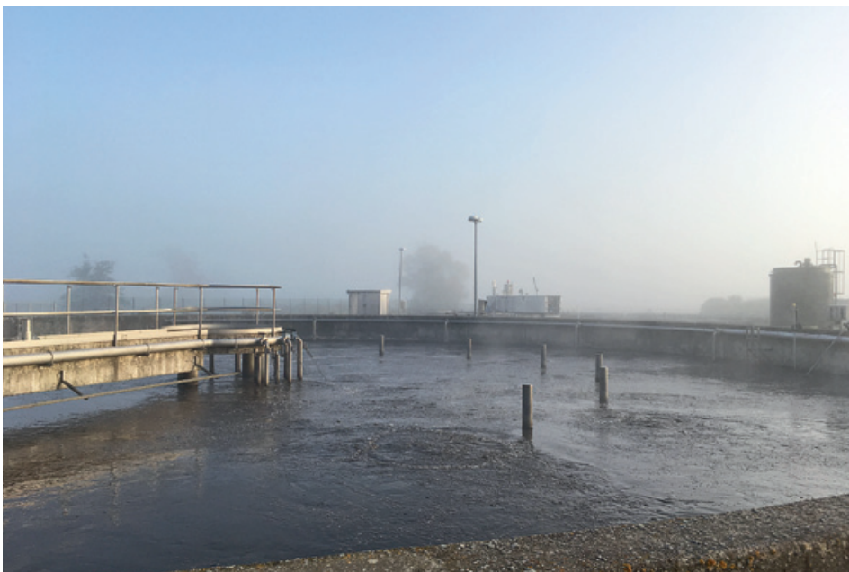
Das Belebungsbecken (Belebtschlamm)

Im Nachklärbecken befindet sich dann das gereinigte Abwasser (Bild, rechts unten).