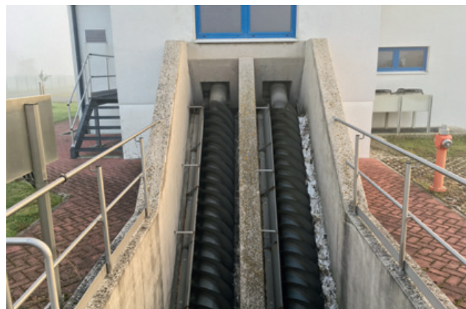
Schneckenhebewerk: An der rechten Schnecke erkennt man festhängende Feuchttücher.

Feuchttücher zersetzen sich im Abwasser nur sehr schlecht bzw. gar nicht. Sie landen entweder direkt bei uns in der Kläranlage (siehe Bild), oder landen in unseren Pumpstationen. Dort gelangen sie in die Pumpen und verstopfen dort die Laufräder. Das führt oftmals zum Ausfall der Pumpen. Dies bedeutet für uns als Kläranlagenpersonal einen erheblichen Mehraufwand, auch außerhalb der normalen Arbeitszeit, da wir die Pumpen öffnen und von den Feuchttüchern befreien müssen. Feuchttücher müssen